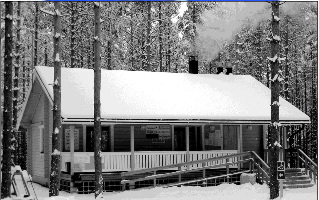
Latumaja, Hevosmäentie 88